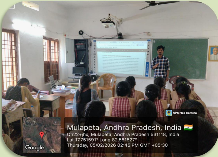
Mulapeta, Andhra Pradesh, India Qh22+jhx, Mulapeta, Andhra Pradesh 531118, India Lat 17.751591° Long 82.551527° Thursday, 05/02/2026 02:45 PM GMT +05:30