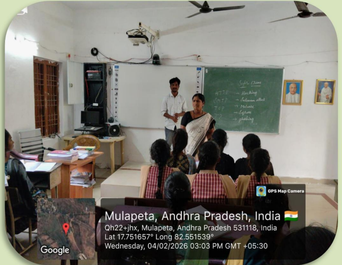
Mulapeta, Andhra Pradesh, India Qh22+jhx, Mulapeta, Andhra Pradesh 531118, India Lat 17.751657° Long 82.551539° Wednesday, 04/02/2026 03:03 PM GMT +05:30